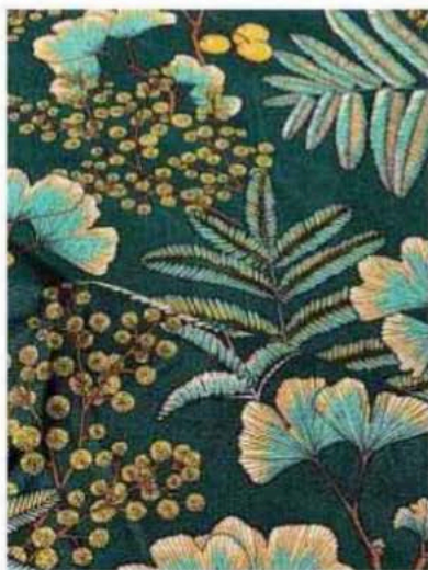
Tissu d'ameublement Thevenon.

Ce samedi 18, le livre sera le roi de la nuit. Cette quatrième édition de la Nuit de la lecture rassemble auteurs, institutions, librairies, bibliothèques... Entre marathons de lecture, escape games, ateliers d'éloquence et discussions