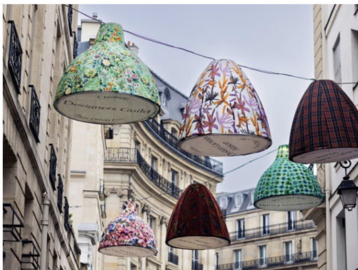
Paris Déco Off 2026 : le décor est à l'honneur pour cette 16e édition.

Présentation des dernières collections, secrets de fabrication révélés, scénographies et démonstrations attendent les visiteurs.